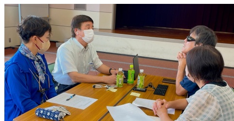
写真 相談会の様子