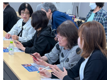
写真 ユーザーとサポーターの様子

全11回コース、前半の5回でSiri、電話とメール、6回～11回でよく使うアプリの使い方(印刷物の活字の読み上げ、Zoomアプリなど)