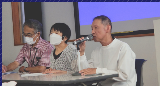
写真 スマホ活用フォーラム2024