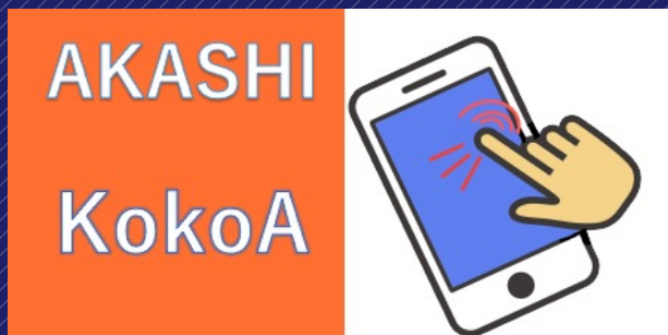
イラスト 明石スマホの会のロゴ