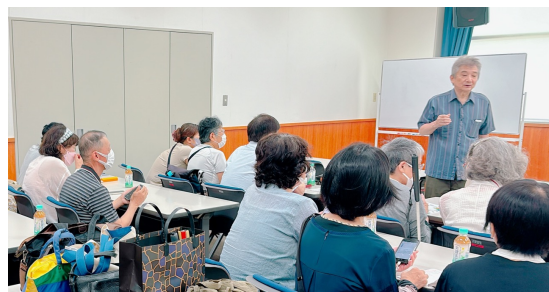
写真 スマホ教室の様子