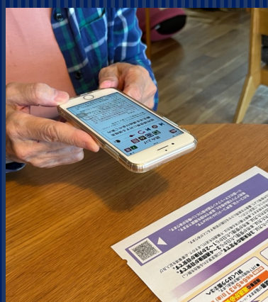
写真 スマホで音声コードを読みとり

近年、スマホ利用を前提としたデジタル社会が急速に進んでいます。スマホには、コミュニケーション機能のほか、「活字を読み上げる」「歩行中に障害物や信号の色を知らせてくれる」など、視覚や歩行を補助する機能があり、視覚障害者にとって、今や必須の生活ツールといわれています。しかし、その普及は進んでいないのが実情です。